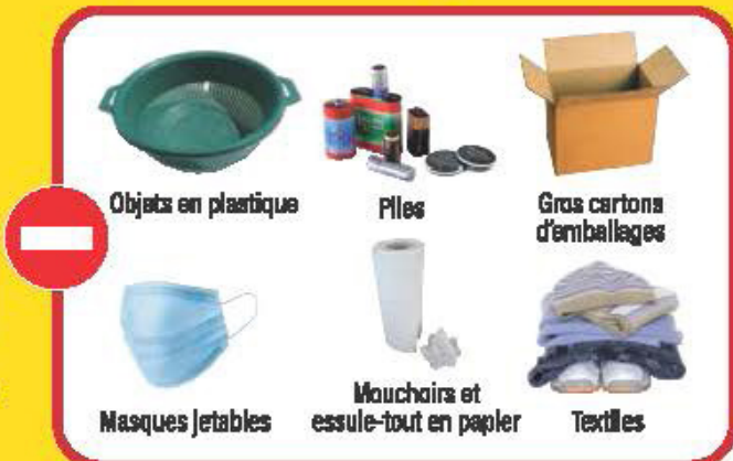
Objets en plastique