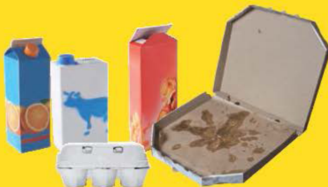
Briques alimentaires et emballages en carton