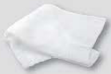
Mouchoirs et lingettes