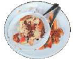
Restes de repas (pâtes, riz, légumes...)