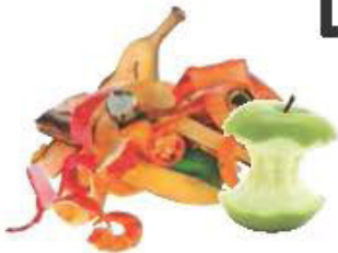
Pelures de fruits et épluchures de légumes