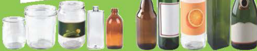
Pots, bocaux, flacons en verre