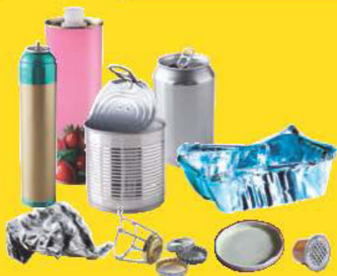
Emballages métalliques y compris les petits

LAISSER LES BOUCHONS, INUTILE DE LAYER LES EMBALLAGES, NE PAS LES IMBRIQUER, LES DÉPOSER EN VRAC (PAS EN SAC).