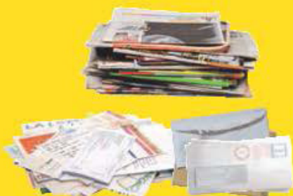
Tous les papiers : journaux, magazines, publicités, enveloppes, courriers, cahiers, ...