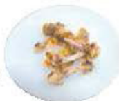
Restes de viande, poisson, fromage