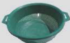
Objets en plastique