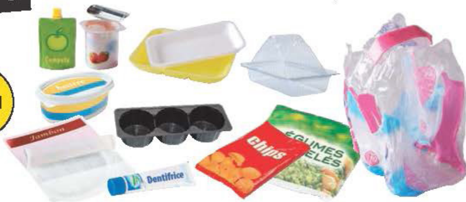
Pots, gourdes, tubes, sachets, films, barquettes, ...

LAISSER LES BOUCHONS, INUTILE DE LAYER LES EMBALLAGES, NE PAS LES IMBRIQUER, LES DÉPOSER EN VRAC (PAS EN SAC).