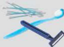
Cotons-tiges, brosses à dents, rasoirs jetables