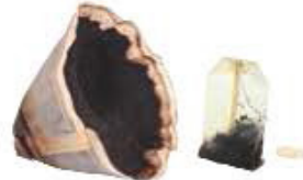
Filtres et marc de café, sachets de thé et infusion