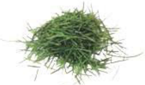
Tontes de gazon