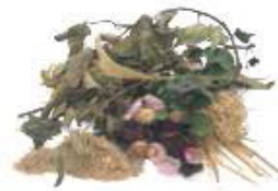
Fleurs, plantes, fraîches ou fanées