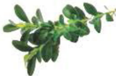
Tailles de haies, tiges dures coupées