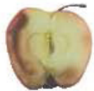
Fruits et légumes abîmés